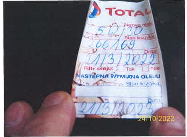
Widok przedziału silnikowego oraz przeglądowa zawieszka informacyjna