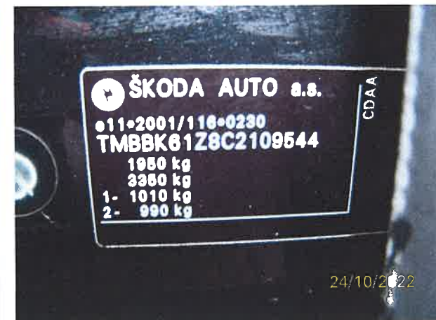
Wskazania licznika km i tabliczka znamionowa z numerem nadwozia VIN