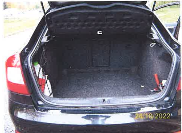
Ogólny widok tyłu pojazdu i przedziału bagażowego